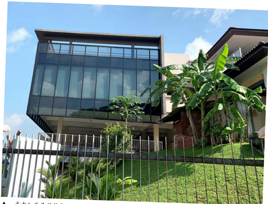
▲ 武吉知马圣若瑟堂小圣堂外的香蕉树和木瓜树，仿佛连着着圣堂所处山头的从前