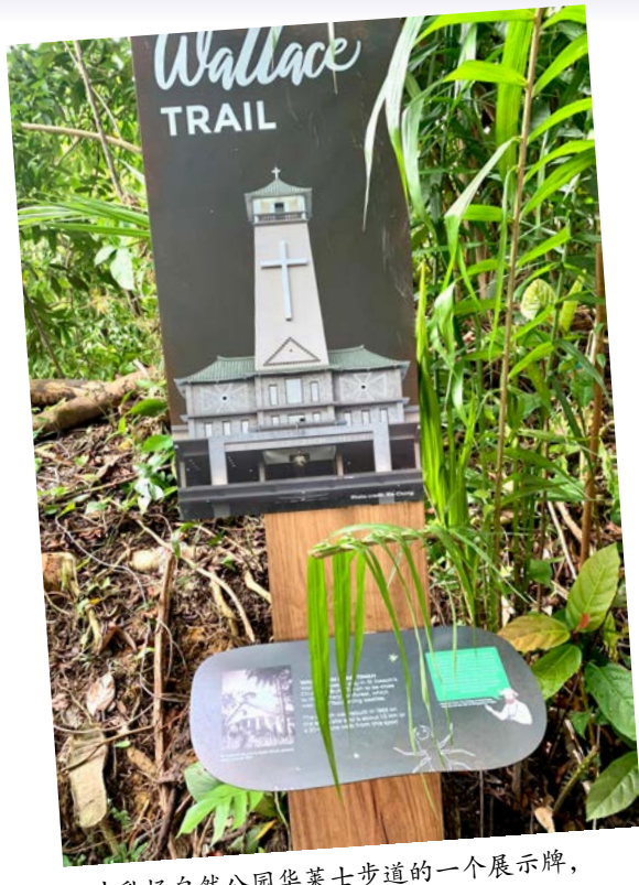
▲ 牛乳场自然公园华莱士步道的一个展示牌，略述华氏 住宿于圣若瑟堂事迹

复活节当天一早到武吉知马圣若瑟堂参加弥撒，每位出席者都获得一袋贴心的礼物，包括一张很别致的书签。今年是圣若瑟年，它的一面有圣若瑟像和祷文；今年也是圣若瑟堂成立175周年，它的另一面列出堂史重大事件，上有三位神父的名字。是这书签引发本文创作灵感，赞美天主！