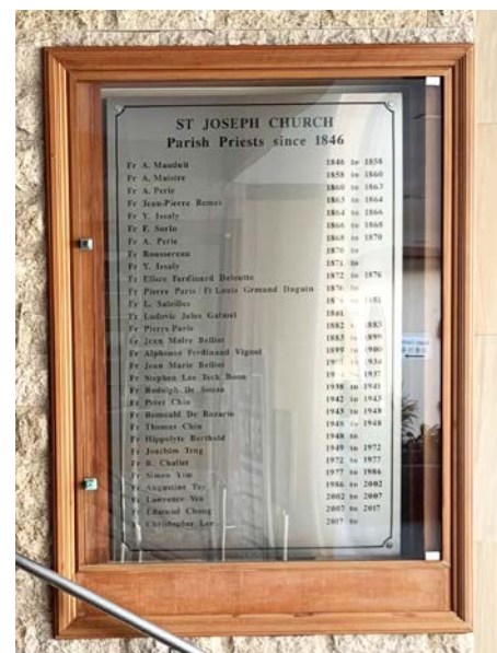
▲ 圣若瑟堂入口处匾牌